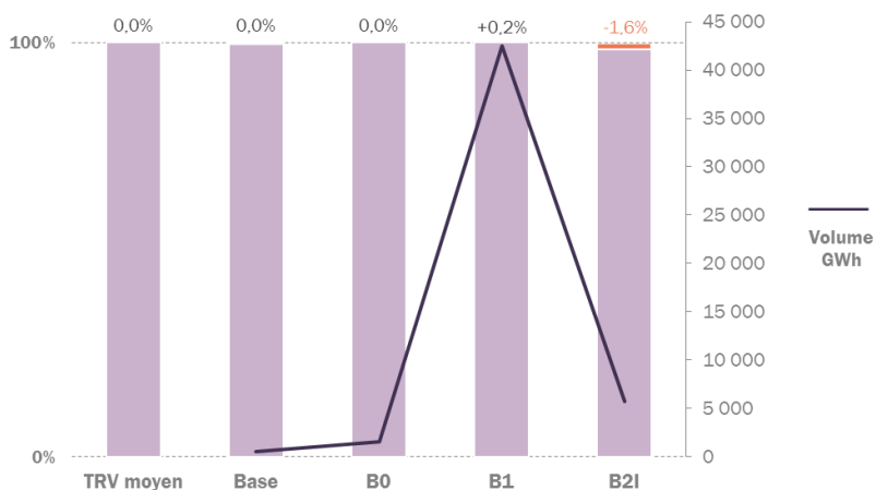
Figure 1. Couverture des coûts, marge et correction au titre des écarts 2016 comprises, par les tarifs réglementés de vente de gaz naturel soumis à l'avis de la CRE

Le tarif B2I, qui ne concerne plus qu'un nombre très limité de clients et dont les barèmes sont, comme les années précédentes, identiques au tarif B1, affiche un léger déficit de couverture des coûts marge et correction au titre des écarts 2016 comprises. La couverture est néanmoins assurée sur l'ensemble des clients B1 et B2I.