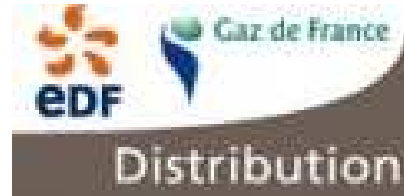
Logo EDF Gaz de France Distribution

Cet état de fait est particulièrement préjudiciable, dans la mesure où il entretient la confusion dans l'esprit du grand public, d'autant plus qu'il concerne les agents mêmes, qui au contact des particuliers, portent le message sur les évolutions du secteur et l'indépendance du gestionnaire de réseaux de distribution par rapport aux fournisseurs.