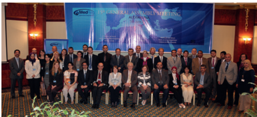
Participants à la 15 e assemblée générale de MEDREG le 5 juin 2013 à Alexandrie en Égypte.

Pont entre l'Union européenne et les pays du sud de la Méditerranée, MEDREG est impliqué dans la mise en œuvre du plan d'action IMME, Intégration des marchés de l'électricité dans les pays du Maghreb. L'association organisera un séminaire dédié à l'ouverture et aux réformes des marchés de l'électricité dans ces pays en septembre 2013.