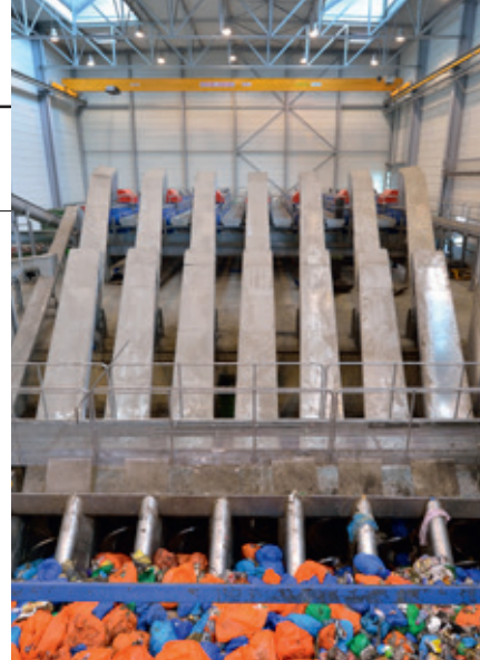
Site de méthanisation de Méthavalor (57).

Sur le réseau de transport, les premières injections de biométhane sont prévues à l'horizon 2014-2015. Environ quatre-vingts projets de raccordement sont en cours, dont une quinzaine ont fait l'objet d'études de faisabilité.