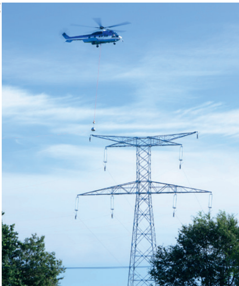
Levage de pylône sur la ligne Cotentin-Maine (52), le 8 août 2012.

Le nouveau tarif de transport (TURPE 4 HTB), fixé par la CRE dans sa décision du 3 avril 2013, permet de répondre à plusieurs objectifs, parmi lesquels :